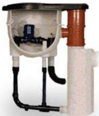
Hausanschlusschacht mit Ventil und Steuereinheit